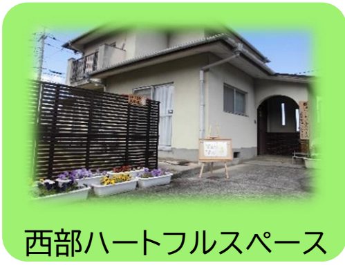
西部ハートフルスペース