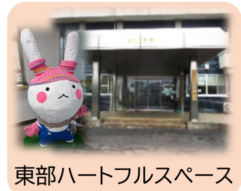
東部ハートフルスペース