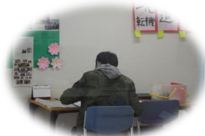
目標に向かって学習