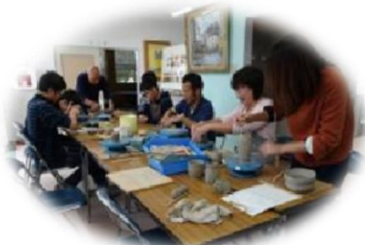
陶芸活動「手びねり」