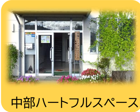
中部ハートフルスペース